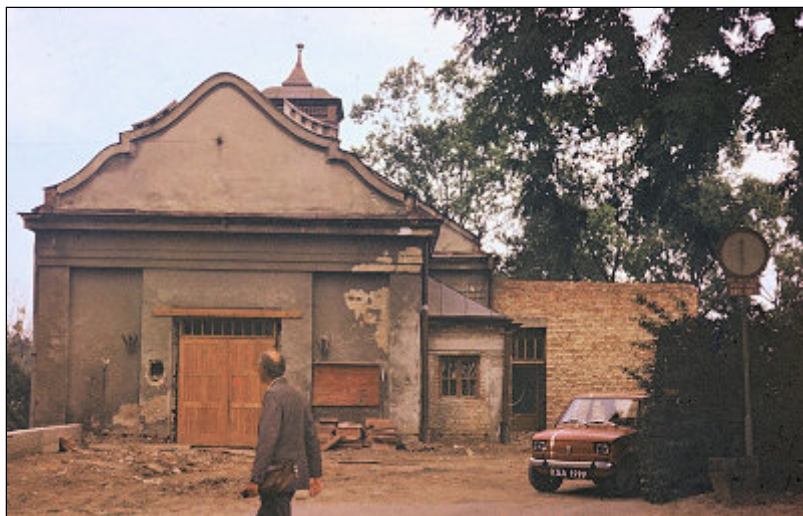
1981 rok - remont budynku przy ul. Blich, w którym kilkanaście miesięcy później powstało Biuro Wystaw Artystycznych

Biuro Wystaw Artystycznych obchodziło (19.05) jubileusz 25-lecia. Uroczystość była okazją do wspominania początków działalności instytucji. W czasach PRL-u nie były one łatwe. Zachowało się kilka pism, w których BWA zwraca się z prośbą np. o przydział 100 kg masy mięsnej na plener, w którym wezmą udział goście z ZSRR i NRD.