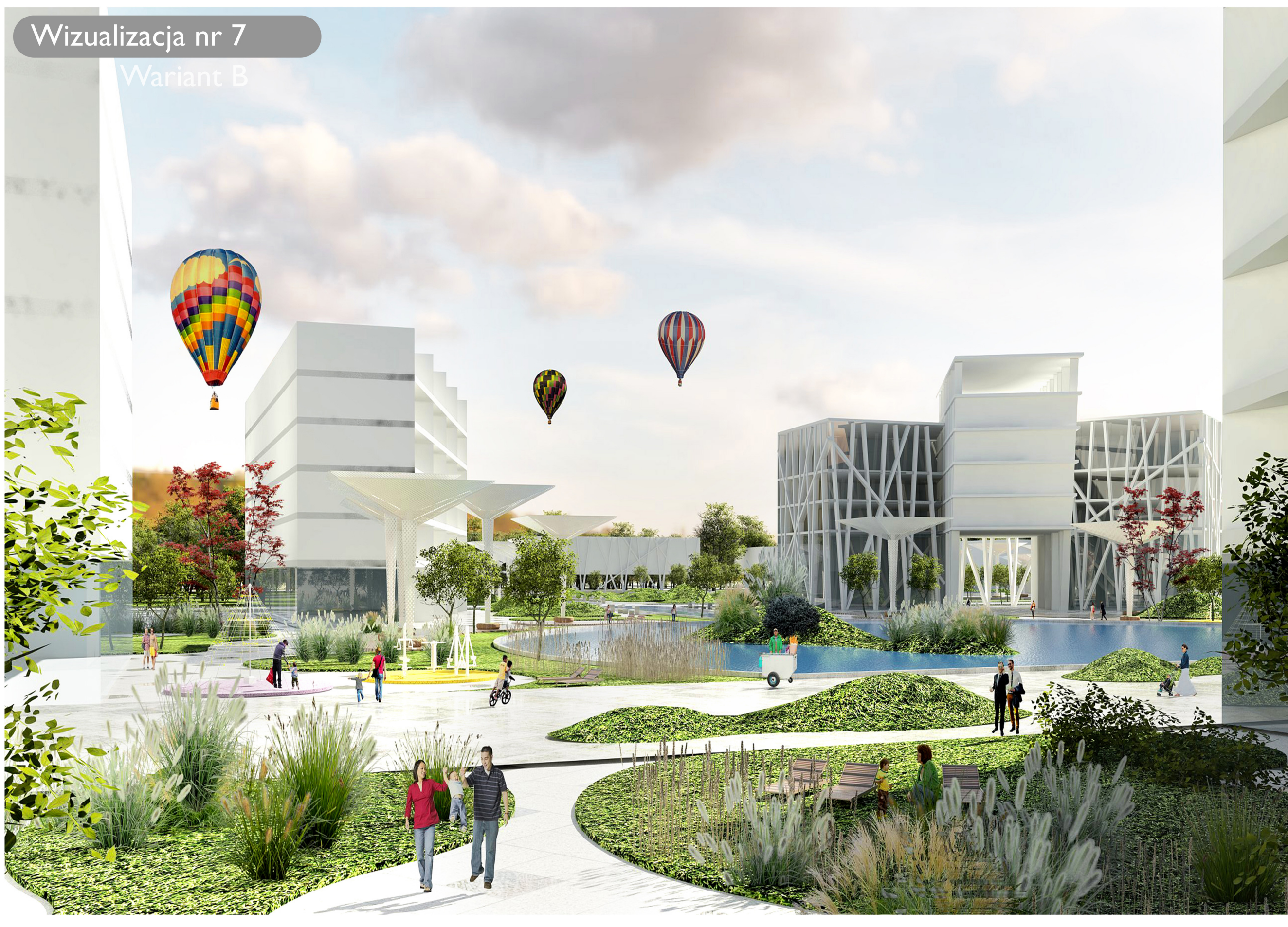
Wizualizacja nr 7