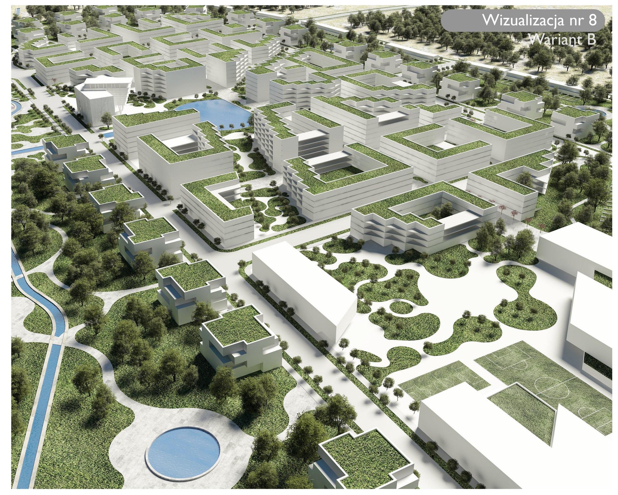
Wizualizacja nr 8