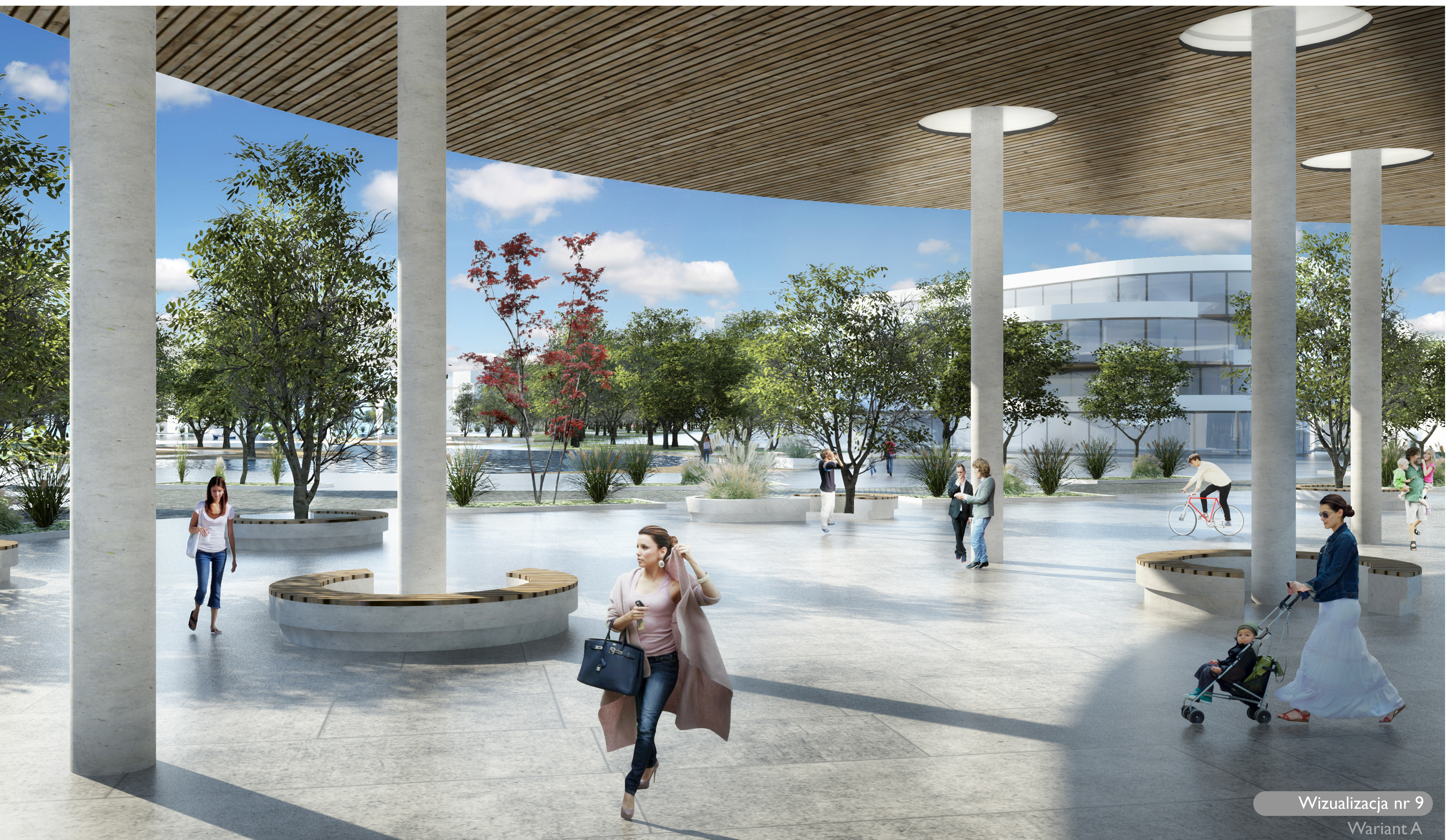
Wizualizacja nr 9